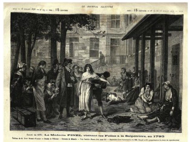
Fig. 7. Gravure parue le 16 juillet 1876 dans Le Journal Illustré (Collection OW).

Victor Charbuliez (1829–1899) écrit dans la Revue des Deux Mondes : « Parmi les toiles les plus remarquées du Salon, il en est une encore qui pêche surtout par le défaut d'une composition trop délayée, et qui paraît trop grande parce que l'ordonnance en est défectueuse. Ce n'est pas que le sujet en soit insignifiant et ne méritait pas les honneurs du grand format ; au contraire, il est d'un intérêt poignant, Pénible, presque douloureux, il demandait à être sauvé [...]. Rien de plus touchant ni de mieux conçu que ce groupe ; mais il fallait s'en tenir là et le reste dans les fuyants du tableau. Un fou tranquille est déjà une compagnie gênante ; vingt folles furieuses sont un spectacle répugnant. Robert Fleury s'est plu à étaler ses folles, la cour en est pleine, nous les voyons partout liées à des poteaux, l'œil hagard, la bouche tordue ou écumante. Passe encore s'il avait songé à égayer cette scène par quelque peu de lumière, à recréer nos yeux par les artifices et les séductions de la couleur. Il a écrit sa tragédie dans un style de peinture froid, uni, un peu terne, par trop sage, qu'il manque de montant ; c'est la langue de Scribe aux incorrections près » [4].