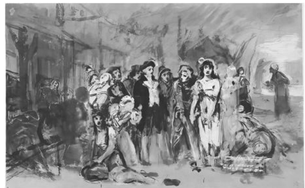
Fig. 4. Premier croquis de mise en place des personnages (© Musée national d'Art, Bucarest).

La Wellcome Collection de Londres possède une toile d'étude, pochade à l'huile assez grossière de taille modeste (50 × 36 cm)