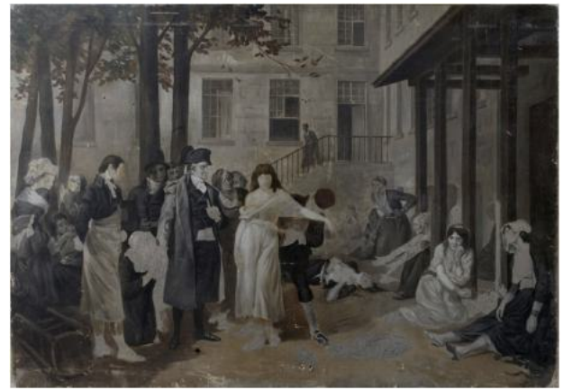
Fig. 6. Toile en grisaille (Collection OW).

pourrait briguer une récompense légitime eu égard à l'utilité et à la moralité de cette page historique » [25]. Victor de Swarte (1848–1917) poursuit : « La pièce la plus en vue de cette salle est la grande toile de M. Tony Robert-Fleury, représentant le docteur Pinel faisant enlever les chaînes aux pauvres folles de La Salpêtrière en 1795. La douceur de la figure de Pinel, qui aussi admirablement campé, contraste avec les torsions effrayantes des malheureuses. Le fond du tableau n'est-il pas un peu conçu et peint en décor de théâtre ? » [8].