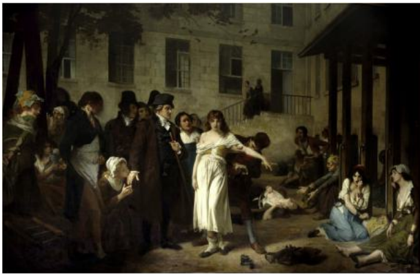
Fig. 3. Tableau en version finale tel que Charcot l'admirait.

invoca en leur faveur les lois de l'humanité. En substituant aux violences, aux mauvais traitements, des moyens de répression sagement combinés, il fut le promoteur d'une réforme matérielle et morale qui devait plus tard atteindre son entier développement » [3]. Mais que nous apprend, en réalité, l'histoire ?