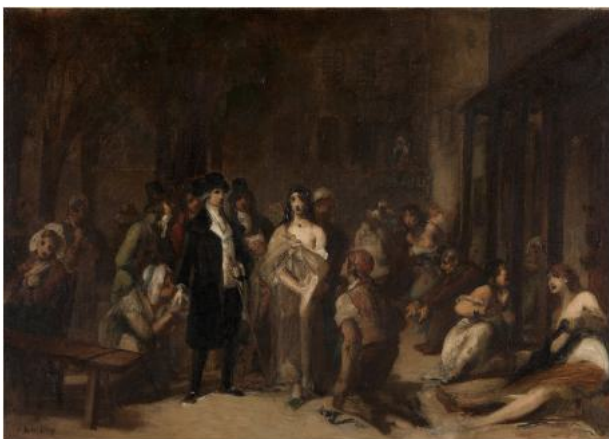
Fig. 5. Toile d'étude signée en bas à gauche.

Comme à l'accoutumée, les critiques divergent du tout au tout, de la bienveillance à l'acrimonie [5]. Pour Théodore Véron (1820–1898) : « Cette œuvre est remarquable de pensée et d'exécution ; c'est encore une des meilleures toiles de cette année, et qui