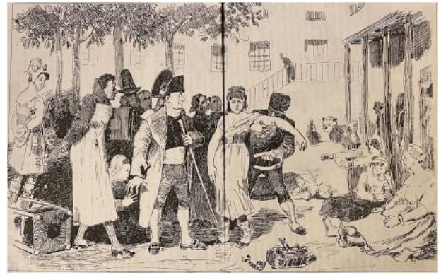
Fig. 8. Caricature parue dans le journal ZIGZAG du 14 mai 1876.

Gladys Swain (1945–1993) suggère que la localisation explicite de la scène à la Salpêtrière est une suggestion venue de la Société Médico-Psychologique afin de revaloriser l'importance de cet hospice où, depuis Pinel, se sont succédé nombre des aliénistes qui ont fondé la psychiatrie française, alors qu'au même moment, Charcot y conduit ses recherches à l'origine d'une nouvelle spécialité, la neurologie [24]. Grâce à son ancien interne Désiré-