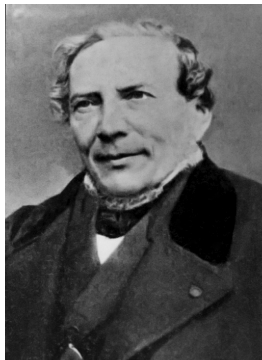
Fig. 1. Portrait Maximien Parchappe.

Commence alors une période de quinze années, la plus féconde en travaux d'anatomie et de physiologie, essentiellement consacrés au système nerveux. Doué « d'une immense capacité de travail, d'un besoin incessant de produire, enfin d'un ardent amour pour les progrès de la science » [59], Parchappe multiplie les publications basées sur les abondantes données que l'asile de Saint-Yon lui permet de collecter. Tous ces travaux, présentés ci-dessous, lui ouvrent les portes de l'Académie de médecine dont il devient correspondant en 1846. Il ne sera jamais titulaire car il n'accepte pas d'avoir à se plier aux visites officielles, « donnant ainsi une preuve d'indépendance et de bon sens, tout au détriment de l'Académie, légitime punition des corps privilégiés se recrutant