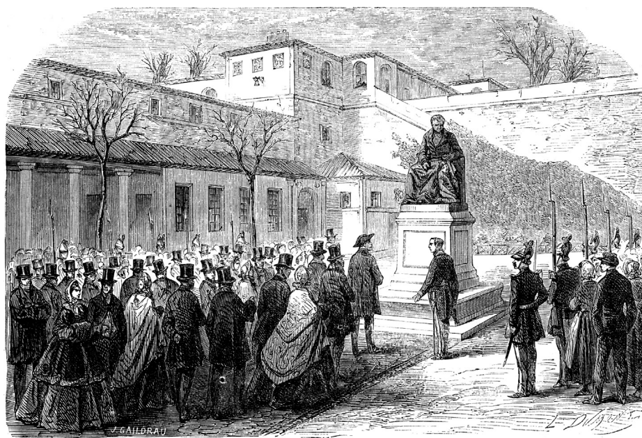
INAUGURATION DE LA STATUE DU D r ESQUIROL, DANS L'ÉTABLISSEMENT DE CHARENTON. — Voir le Courrier de Paris du n° 4031.