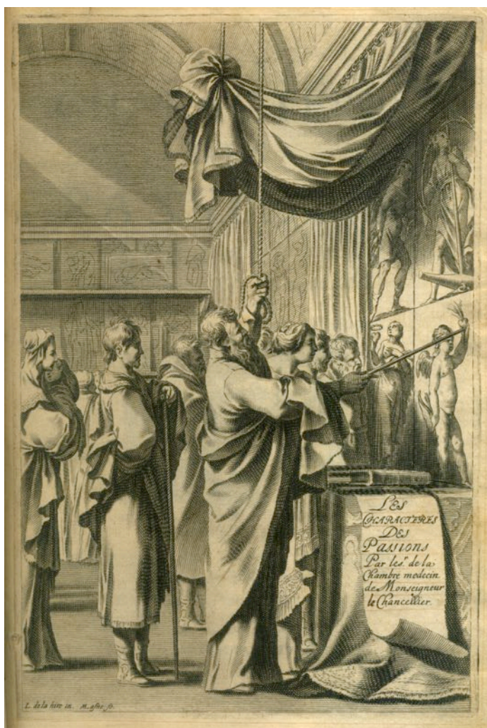
Frontispice gravé par Laurent de La Hire (1606-1656) Le Maître dévoile à ses élèves le cœur où brûlent « des Passions ».

véritable, & qu'elle se fait effectivement, quoy que ce ne soit pas peut estre de la manière qu'ils disent » 22 .