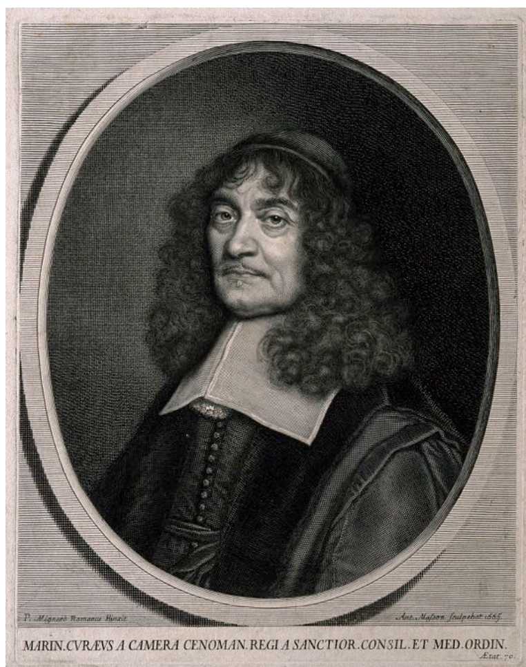
Marin Cureau de La Chambre en 1665 par Antoine Moisson (1636-1700), gravé par Pierre Mignard (1612-1695). Carnegie Museum of Art.

son somptueux hôtel particulier 15 , alors que ce magistrat et homme de pouvoir est « Garde des Sceaux et Chancelier de France » respectivement en 1633 et en 1635, c'est à dire le deuxième personnage de l'État. Celui-ci sera reçu à l'Académie française, qu'il abrite dans son Hôtel particulier depuis l'origine, au fauteuil n°1 le 16 janvier 1635, et devient 'son protecteur' en 1643, après le décès de Richelieu 16 . Séguier meurt trois ans après son médecin, à quatre vingt quatre ans, ce qui justifie la confiance qu'il lui accordait « car le Chancelier, tout dévot qu'il est, est un grand garçailleur, il paie ses demoiselles en arrêts et autres choses semblables, mais comme il y a quelques fois du mal dans ses chausses, La Chambre qui le traite, est fort absolu et se prévaut un peu de la confiance », comme nous le commente Gédéon Tallemant des Réaux (1619-1692) 17 .