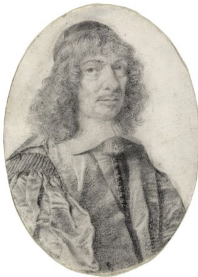
Marin Cureau de La Chambre par Robert Nanteuil (1623-1678) en 1656 (National Gallery of Art, Washington D.C.)

Marin Cureau de La Chambre (1596-1669) est un médecin manseau qui conseille et prodigue ses soins, non seulement à son protecteur Le Chancelier Pierre Séguier, mais à deux Rois de France, Louis XIII et Louis XIV. A la fois médecin et philosophe, membre de l'Académie française et de l'Académie des Sciences dès leur création, sa notoriété aurait pu se borner à celle acquise pour avoir été l'acteur principal du détronement de la langue latine au profit du français comme véhicule de la dissémination des sciences en Europe. Mais ses interprétations « des fonctions de l'Âme » en font un véritable précurseur, oublié ou négligé, de la neuropsychologie grâce aux développements qu'il sût donner à des concepts qui nous apparaissent encore très contemporains touchant les émotions et la mémoire aussi bien chez l'Homme que chez les animaux.