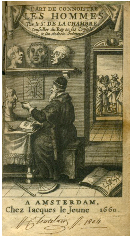
Titre-Frontispice montrant l'auteur, M. Cureau de La Chambre, en physiognomoniste.

soit rusé comme un renard. Son originalité vient d'abord de la distinction qu'il apporte entre les comportements humains et les instincts (cf infra). Il s'inspire pour cela d'une part des travaux de Nicolas Coëffeteau (1574-1623) 33 et de ceux de Jean-François Senault (1599-1672) 34 et d'autre part, du « Traicté de la phisionomie » de Guy de La Brosse (1586-1641) 35 resté à l'état de manuscrit 36 . Celui-ci est conservé par Séguier lui-même, en son hôtel, réputé recéler la plus grande bibliothèque parisienne, à cette époque, après celle de Mazarin 37 . Cureau de La Chambre complète sa démarche en publiant en 1660 « L'art de connoistre les Hommes » 22 dans lequel il développe ses conceptions de physiologie, puis en 1665 « Le système de l'âme » 38 dont les chapitres consacrés à la mémoire demeurent encore conceptuellement pertinents.