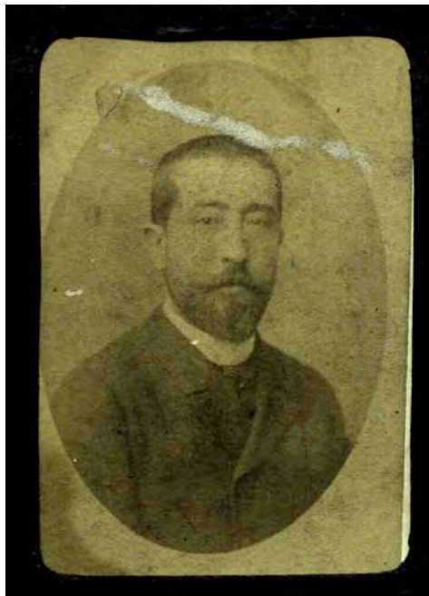
Figure 1 : photo inédite de Georges Gilles de la Tourette vers 1885

Maladie de Gilles de la Tourette, la joliesse de l'éponyme a sa part dans la notoriété de Georges Gilles de la Tourette. Il s'y attache un certain exotisme, pour les anglo-saxons, mais aussi une petite vanité onomastique et nobiliaire. Les propos tenus par une mère de malade et rapportés par Arthur K. Shapiro (1923–1995) « quel joli nom pour une aussi terrible maladie » illustrent toute l'ambivalence qui lui est attachée.