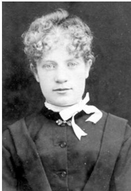
Figure 3 : Marie dite Blanche Wittmann (1859-1913)

çais, a une préface de Paul Brouardel): « M. Gilles de la Tourette a posé les fondements de son oeuvre sur des expériences significatives. Sans sous-estimer la part incombant aux phénomènes psychiques, il a pris, à juste titre, comme ligne conductrice la totalité du 'stigmaté' somatique et dans cette voie, il montre qu'une expertise médico-légale est nécessaire et qu'elle doit s'appuyer sur des hypothèses tout à fait sûres et qui ont un poids prépondérant quant à la décision finale ». Trois femmes et l'hypnotisme vont permettre à Gilles de la Tourette d'incarner le sage de l'épigramme d'Oscar Wilde (1854-1900): « les gens bien élevés contredisent les autres. Les sages se contredisent eux-mêmes » (7).